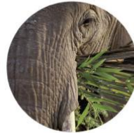
Transport de marchandises