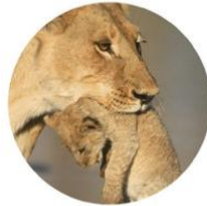
Transport de voyageurs

Vous transportez la vie, nous protégeons la vôtre